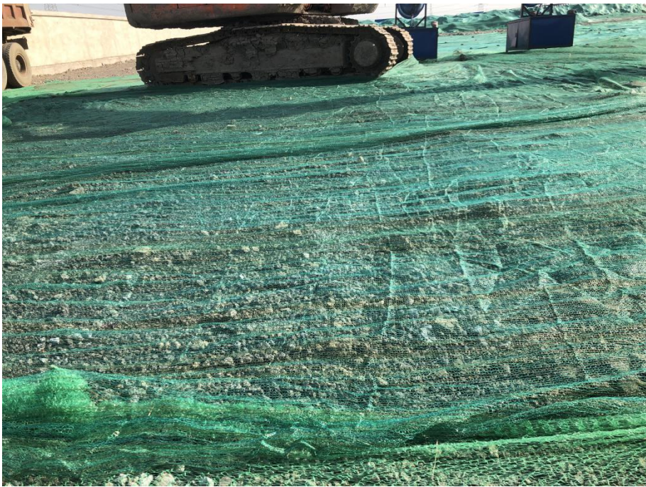
施工期密目网苫盖