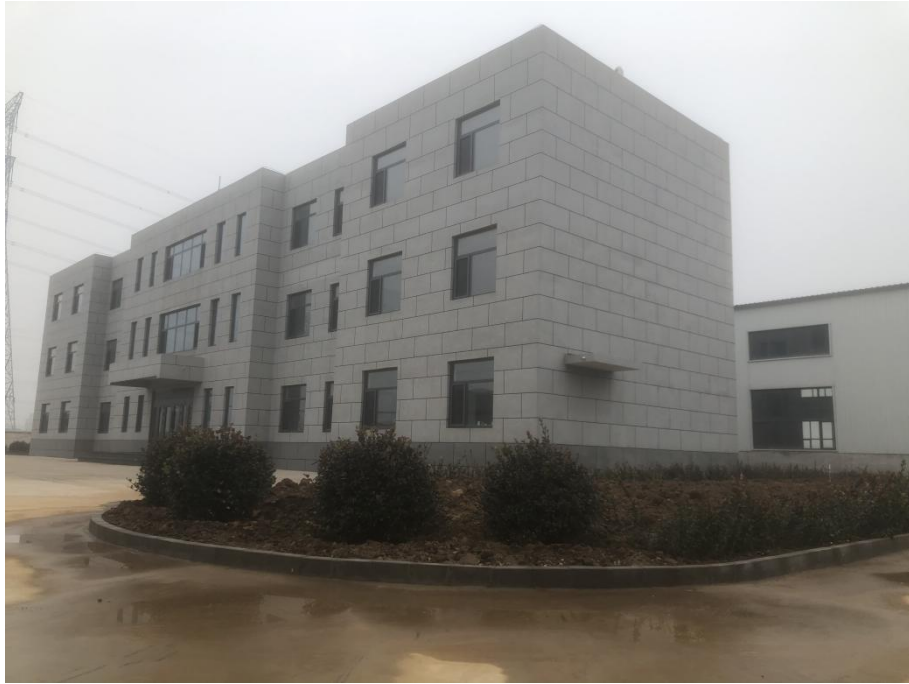
建构筑物区及绿化区现状