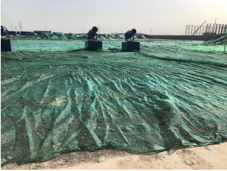
施工期密目网苫盖